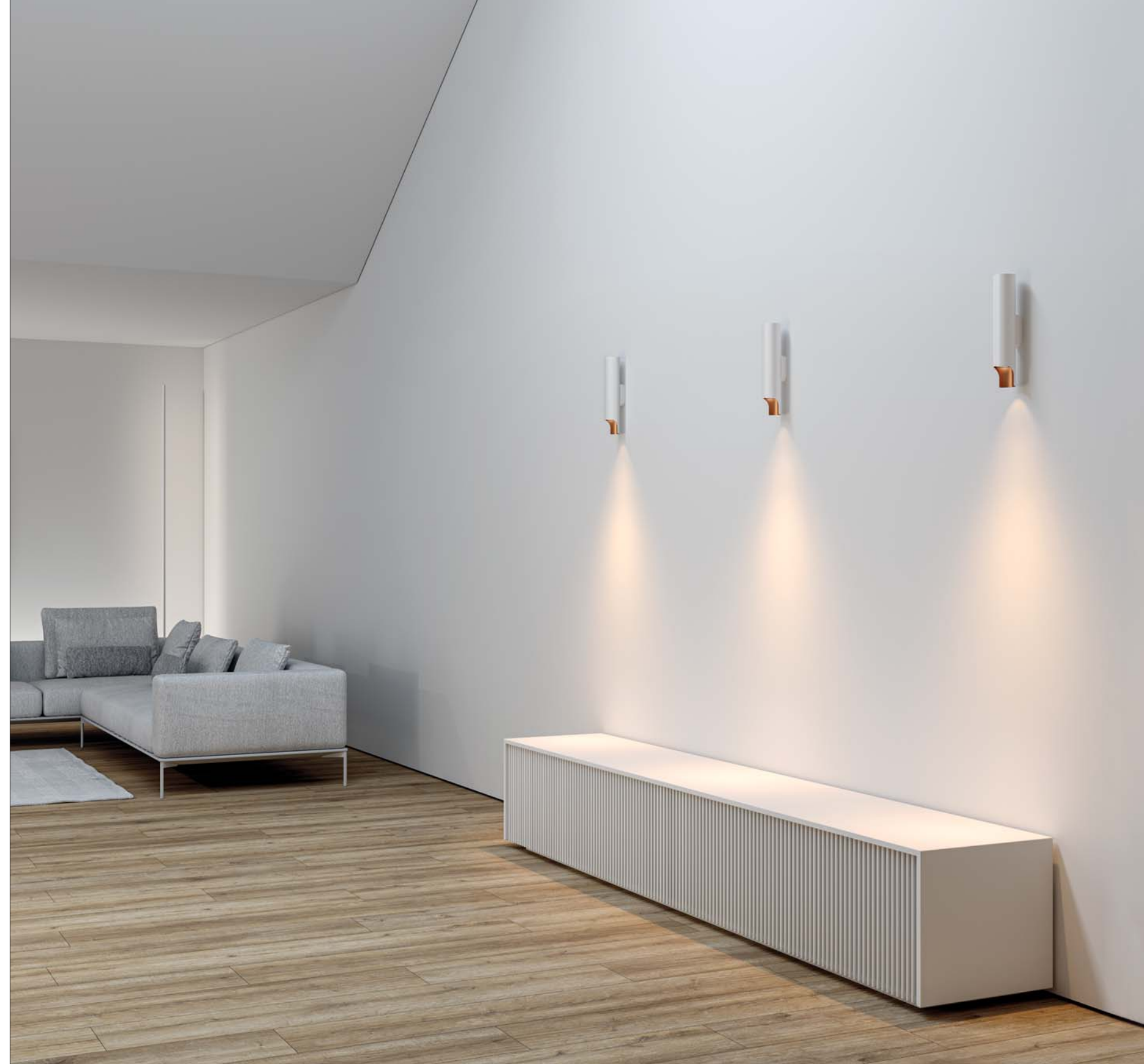
RC Red/Copper - Rosso/Rame